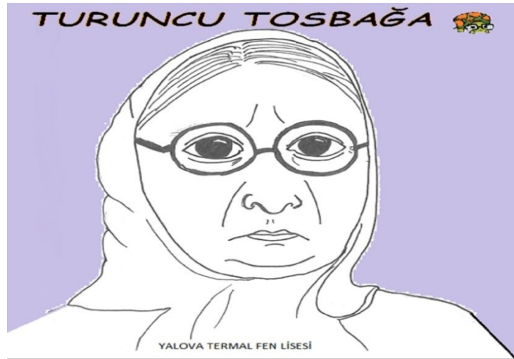
(Turuncu Tosbağa İlk Sayısı)